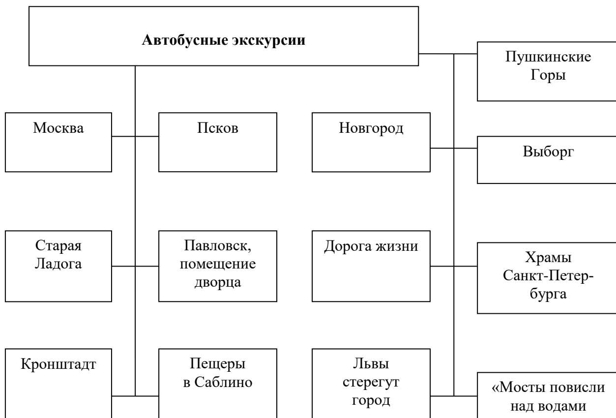
Схема Г. Программа «Автобусные экскурсии».