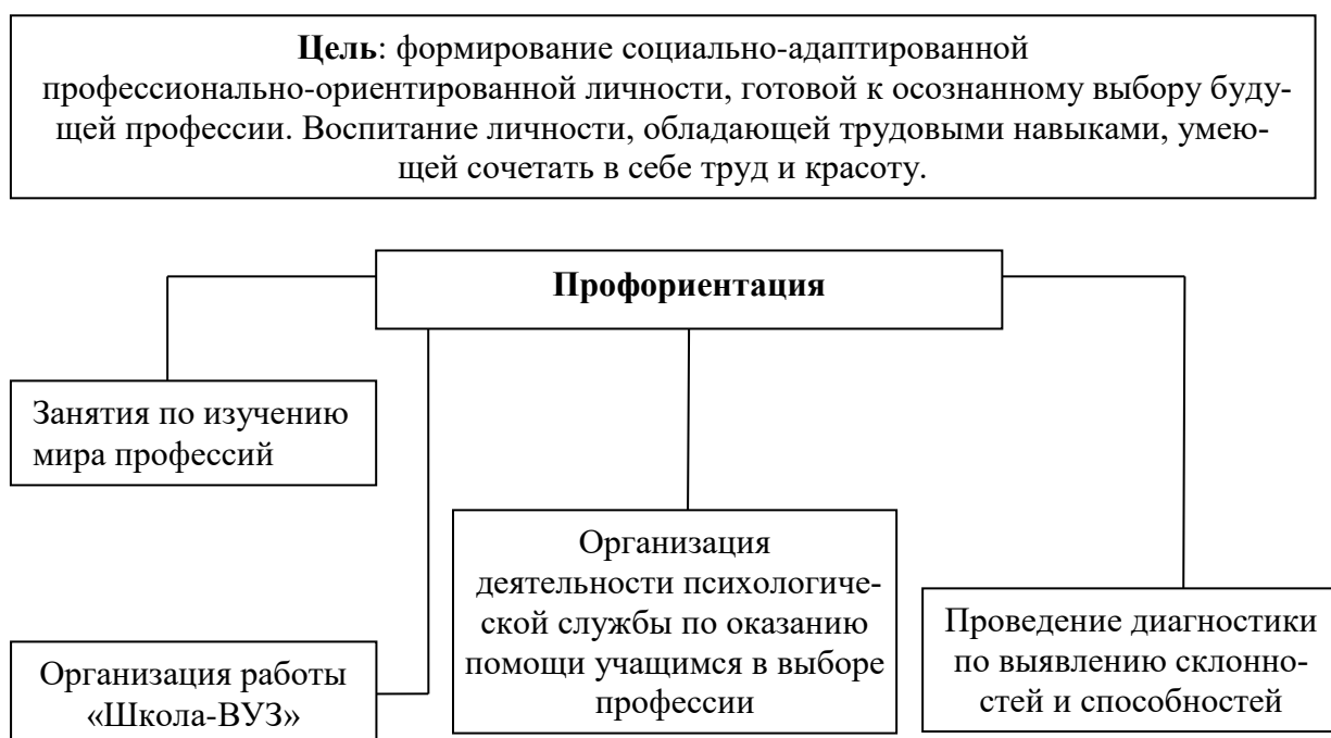
Схема Е. Программа «Профессионализация».

4. Программа профориентации и допрофессиональной подготовки, направленные на помощь учащимся в осознанном выборе профессии представлены на схеме Е.